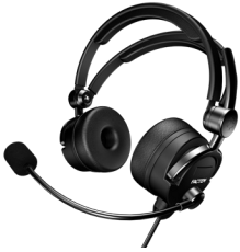
FL20-P : Passive noise reduction FL20-P: Anti-bruit passif

Les casques de la gamme FL20 sont légers, confortables et robustes. Ils sont conçus pour répondre aux besoins des opérationnels et disponibles en différentes versions. Optimisez la communication à bord avec nos casques haut de gamme, conçus pour les environnements exigeants des passerelles et salles de contrôle des navires militaires.