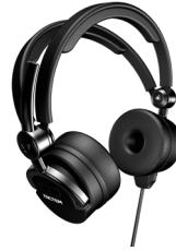
FL20-L : Listen only with passive noise reduction FL20-L : Ecoute seule avec réduction passive de bruit