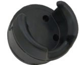
G16639 Hanging bracket for handsets Support d'accroche pour combinés