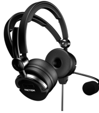
FL20-IA : Active noise reduction (ANR/20dB) FL20-IA : Réduction active de bruit (ANR/20dB)