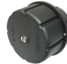
G629 Calling howler Magnéto d'appel