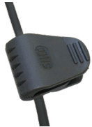
A50369-1 Clothing clip Pince à vêtement