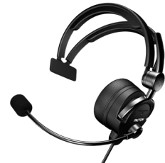
FL20-M : Mono aural FL20-M : Communicant mono-aural