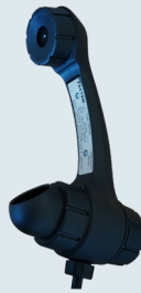
Thermoplastic ATEX handset Combiné thermoplastique ATEX