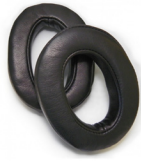
A24963 Leather earpads for AVS Oreillettes cuir pour AVS