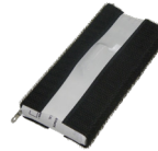
G50509 Equiped battery Batterie équipée