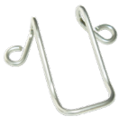
G34412 Hook for intercom Crochet pour interphone